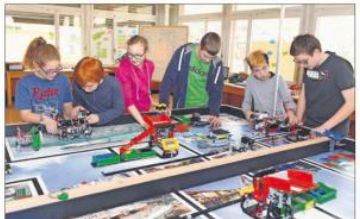
Les roboticiens en herbe jurassiens s'entraînent tous les samedis matins en vue de la première Coupe jurassienne de robotique Lego.

Le Club Robots-JU, seul club de robotique du canton, né voilà cinq ans, organise le 21 mai, dans la grande salle de Cinémont, à Delémont, la première Coupe jurassienne de robotique Lego. L'idée de mettre sur pied une compétition de ce genre était dans l'air depuis longtemps. Les organisateurs ont profité de l'annulation de la Coupe Roberta pour la concrétiser.